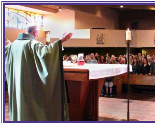
... we praise the Lord ... alabamos al Señor