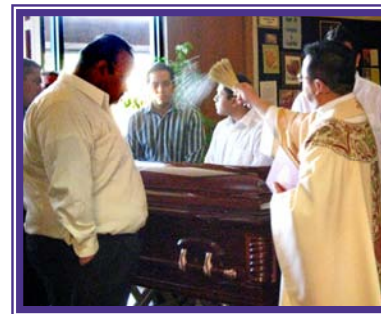
... we comfort those who mourn ... damos consuelo al afligido