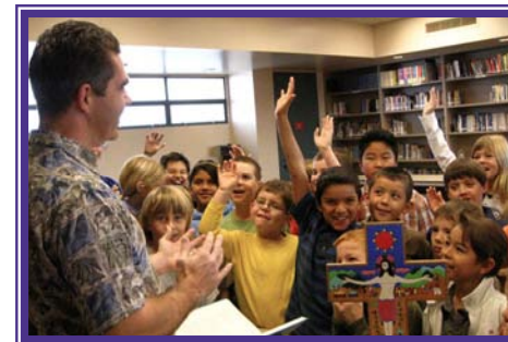
... we share our faith ... compartimos nuestra fe