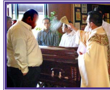
... we comfort those who mourn ... damos consuelo al afligido