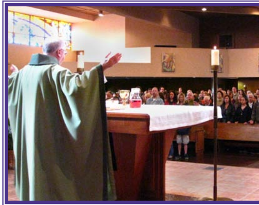
... we praise the Lord ... alabamos al Señor