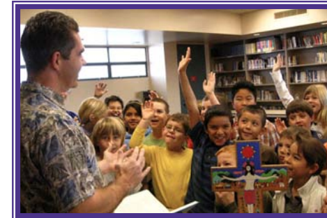
... we share our faith ... compartimos nuestra fe