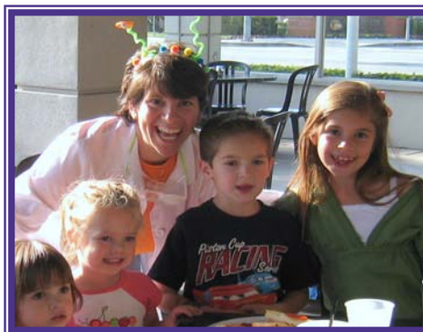
... we celebrate life ... celebramos la vida