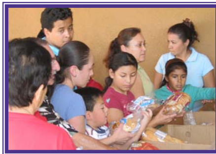
... we feed the hungry ... alimentamos al hambriento